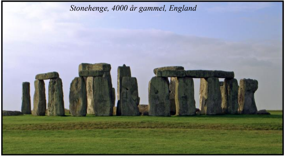
Stonehenge, 4000 år gammel, England

Mange mennesker bliver fanget ind af de smukke citater, men ender med at lide under de mørke. Når man først er kommet ind i en fundamentalistisk fortolkning af religionen er det svært at komme ud, fordi man forbryder sig imod Guds regler. Man skal bryde reglen (skulpturens NO EXIT-skilt) for at komme ud af cirklen.